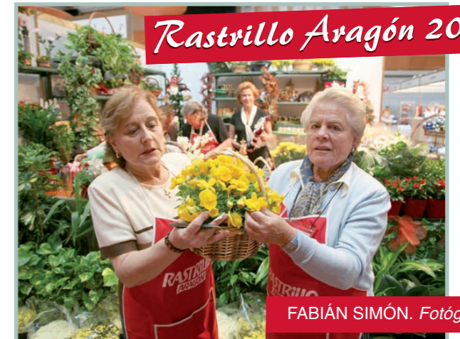
FABIÁN SIMÓN. Fotógrafo