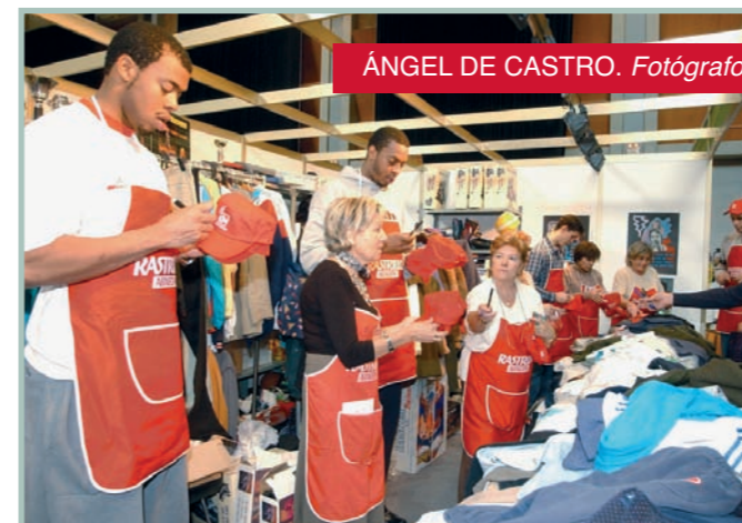
ÁNGEL DE CASTRO. Fotógrafo

Pocos años antes de que el Rastrillo abriera sus puertas, Cecilia hablaba en su canción "Dama, dama" sobre "los tés de caridad, jugando a remediar..." Enfundadas en sus delantales rojos, las voluntarias del Rastrillo dejaron muy claro desde el principio que allí no se jugaba a remediar, que se remediaba, y se sigue remediando, de verdad. Lo hacen con su trabajo constante y callado, que ha llevado al Auditorio a más de un millón de personas estos años y que ha recaudado un dinero destinado a proyectos concretos, a personas con nombre y apellidos. Y siempre con alegría y corazón, que también se dibuja con el color rojo de ese delantal tan prodigioso. ¡Gracias!