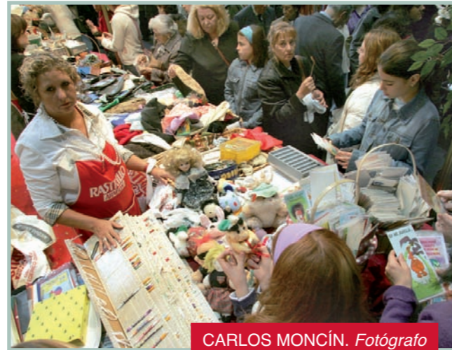
CARLOS MONCÍN. Fotógrafo

“Trabajar por las personas” es el lema que durante años ha guiado al ya veterano y exitoso Rastrillo Aragón de la Fundación Federico Ozanam, que cumple en 2011 su 25 edición. El Rastrillo ha calado en la sociedad zaragozana y ha contado con todo el apoyo y la implicación de los medios de comunicación aragoneses desde su primera edición. Los periodistas entendimos que era importante que colaboráramos con esta iniciativa que presta apoyo a los más desfavorecidos. Siempre nos hemos sentido y nos sentiremos orgullosos de poder contribuir con nuestro trabajo a este gesto solidario.